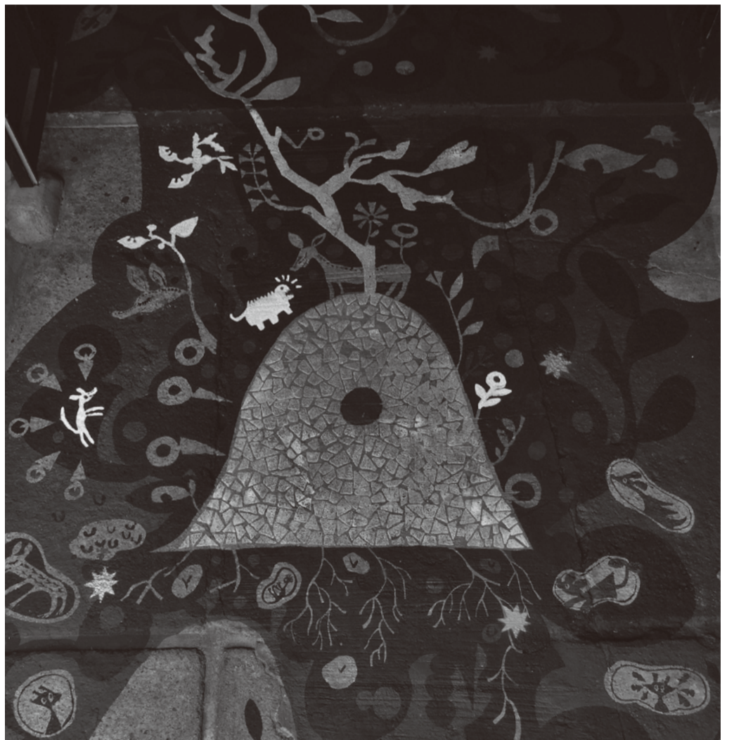
『いのちの星座／Constellation of life』2015,浅井裕介